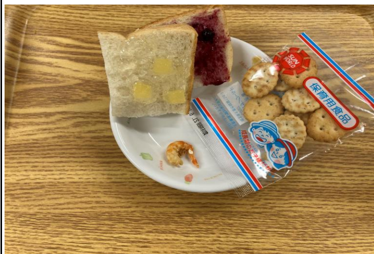
【おやつ：未満児】パン①いろいろジャム・焼き干しえび・お菓子